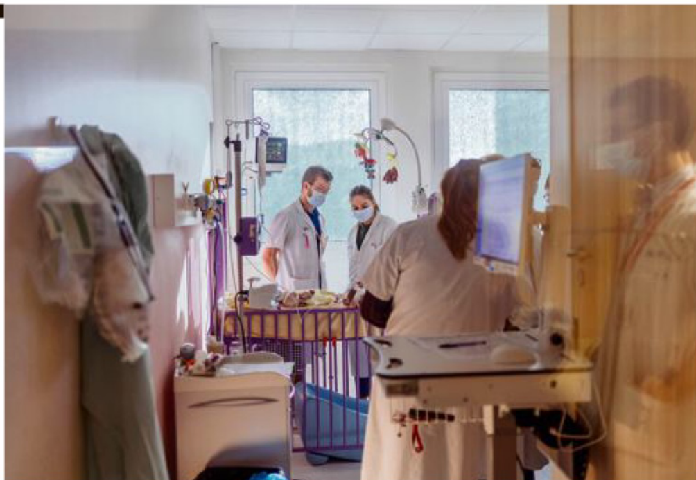
Dans un hôpital public.

Dans Blanches , tous ont choisi d'exercer à Villedeuil. Infirmière, interne, chirurgien en fin de carrière, chacun d'eux se sent à sa place dans cet hôpital de la proche banlieue parisienne. Laetitia, chargée d'accueillir les malades, se réjouit de travailler dans la ville où elle a grandi. Aimée Larrieux, bien classée à l'interne, a décidé, à la surprise de tous, d'apprendre son métier dans cet hôpital où aucun de ses camarades ne voulait aller. Jean-