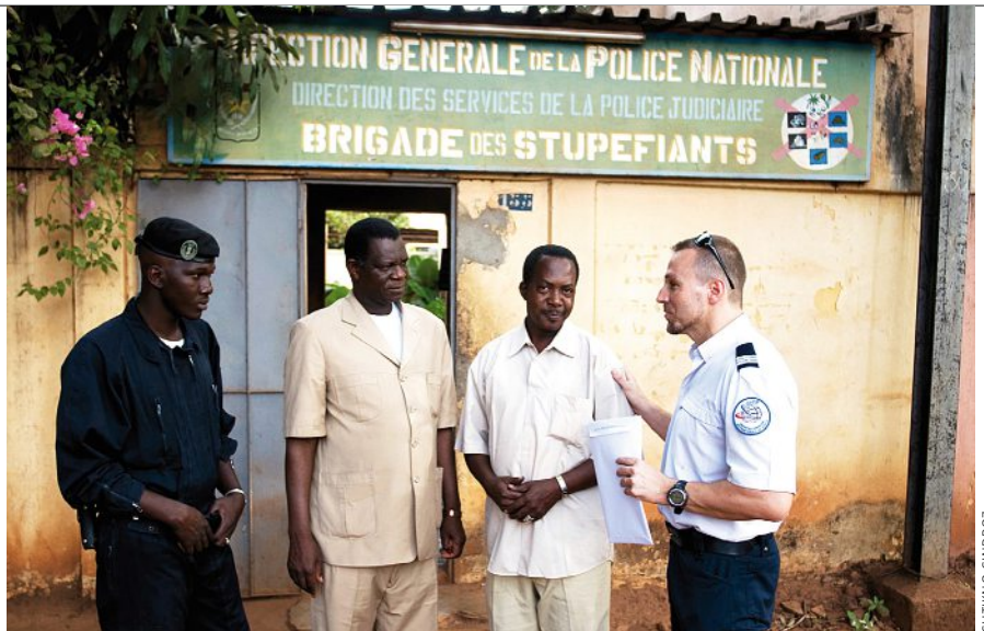
L'auteur, à droite, en compagnie de policiers maliens, en 2016.

« Lorsque l'on parle de crime organisé, on pense aux mafias italo-américaines, de Lucky Luciano à Al Capone, en passant par Meyer Lansky.