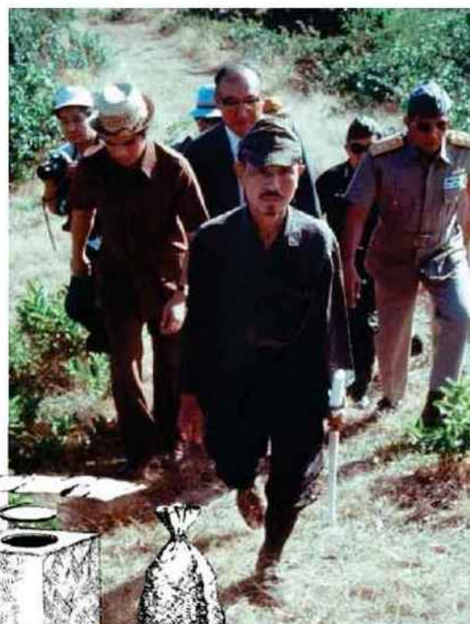
Perdu. Le soldat Hiro Onoda, retrouvé en 1974 sur l'île Lubang, aux Philippines.

Bien qu'il ait récupéré un transistor en 1965, Onoda n'a pas voulu apporter de crédit aux informations qui y étaient diffusées. « Ce qui prétendait être une émission du Japon [...] était, de mon point de vue, un enregistrement concocté par l'ennemi et rediffusé avec les modifications appropriées », pensait-il. Si cet aveu volontaire